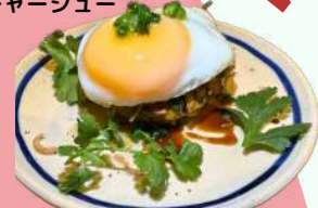
目玉焼き乗せ 大きな肉団子 ¥780