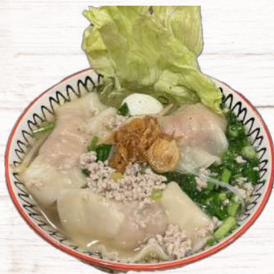
ワンタンフォーティウ 930円