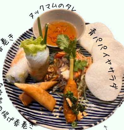
前菜4点盛りプレート ¥1,580