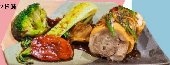
鶏もも肉のパリパリ揚げ 2切れ/ ¥480 | 4切れ/ ¥960