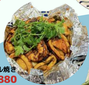
エビ、イカと野菜のオイル焼き ¥880