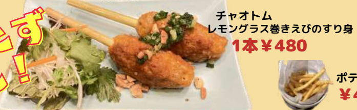
チャオトム レモングラス巻きえびのすり身 1本 ¥480