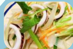
イカと野菜のさっぱり 生姜蒸し ¥780