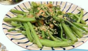
空心菜とニンニク炒め ¥1,200