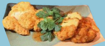
ベトナム2種類のさつま揚げ イカのさつま揚げも ベトナム産自身魚さつま揚げ ¥780