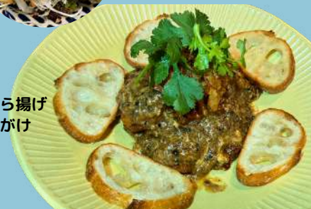
ソフトシェルクラブのから揚げ ブラックペッパーソースがけ ¥1,280