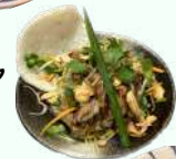
カイワレとパクチー の牛肉サラダ ¥580