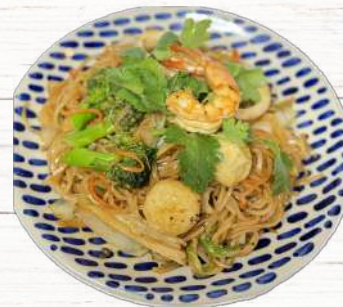
海鮮焼きフォーティウ スープ付き 1000円 野菜焼きフォーティウ スープ付き 950円