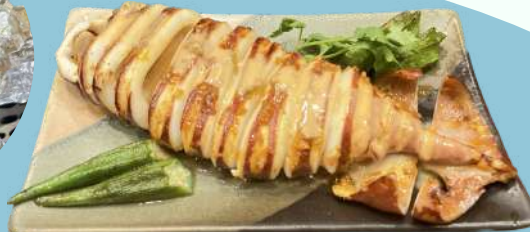
ベトナムラー油のイカ焼き ¥1,200