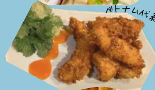
「バス」のから揚げ レモングラス香味 ¥880