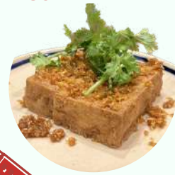
パリパリレモングラスと ピリ辛やみつ揚げ豆腐 ¥780