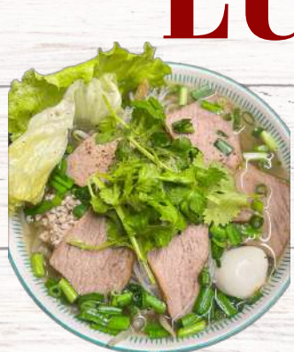
豚肉フォーティウ 880円

ランチ限定 11:00~14:00 (L.O) 全てのメニューは麺少なめ-50円/ 麺大盛り+100円