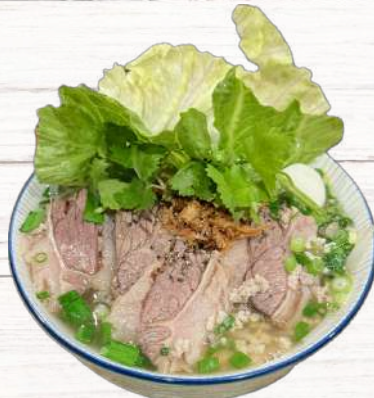
牛肉フォーティウ 980円