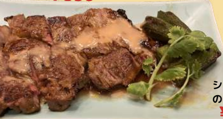
シェフ自慢の特製ソースがけ のグリルビーフ ¥980