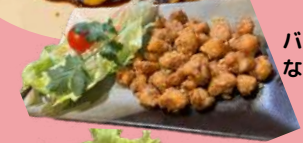
バターにんにく味の なんこつパリパリ揚げ ¥780