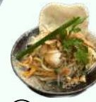
エビ、豚肉 と青パパイヤ サラダ ¥580