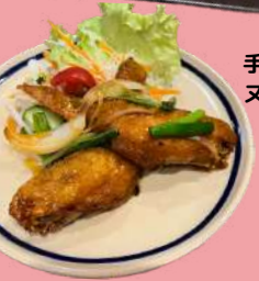
手羽先から揚げ ヌックママ味|タマリンド味 ¥480