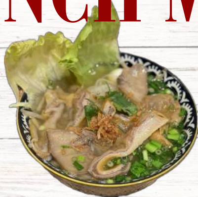
ホルモンフォーティウ 880円