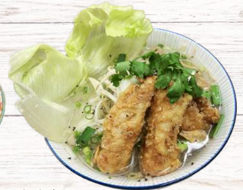
白身魚フライフォーティウ 930円