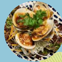
甘酸っぱい! ハマグリ のタマリンド ソース和え ¥1,200