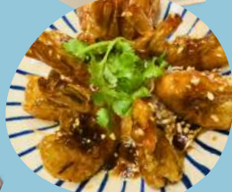
甘酸っぱい! エビの殻ごと素揚げ タマリンドソース和え 8尾 ¥1,360