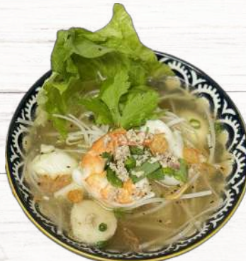
海鮮フォーティウ 980円