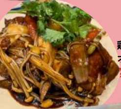
鶏肉とキノコと野菜の オイスターソース炒め ¥780