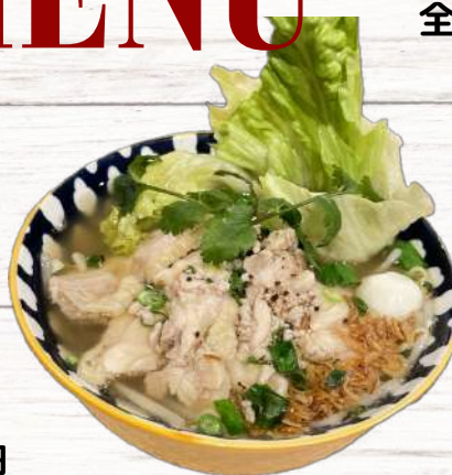
鶏肉フォーティウ 880円