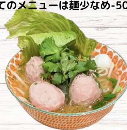
肉団子フォーティウ 930円