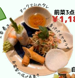
前菜3点盛りプレート ¥1,180