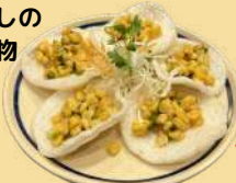
エビゼんのせ にんにく味の コーンバター ¥580