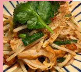
ニラともやしのホルモン炒め ¥980