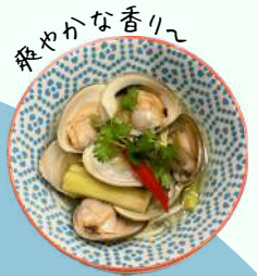
ハマグリ のレモングラス蒸し ¥1,200